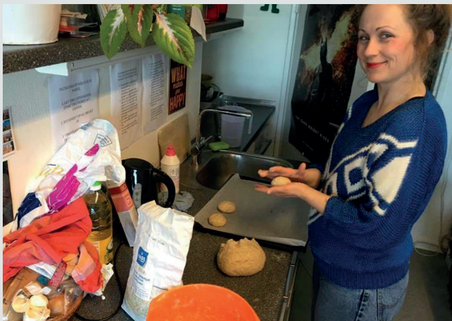
Fælles madlavning skaber samhørighed.

med udgangspunkt i det enkelte menneske. Og det har været en ubetinget succes: Organisationen er vokset år for år, og har fået større og bedre lokaler og faciliteter, som tiden er gået, fra 20 kvadratmeter til større lokaler på havnen i Aarhus, igen til større lokaler på Karupvej ved Silkeborgvej til nu 400 kvadratmeter i Frichsparken lige i udkanten af midtbyen. Personalet er også vokset og tæller i dag otte fuldtidsansatte, to på deltid og to praktikanter. Og så ikke mindst 70 frivillige, som byder ind med professionel støtte og hjælp. Fundamentet er åbent for alle med behov for hjælp og har flere specialiserede tilbud målrettet unge i alderen 18-35.