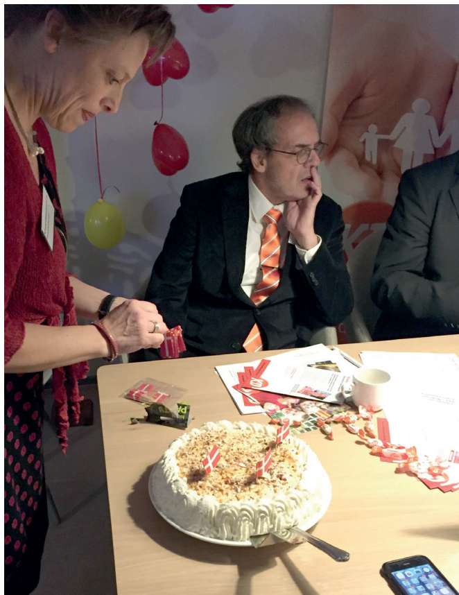
Foto fra et eftertænksomt øjeblik på valgaftenen på Fredensborg Badehotel i Rønne – under stemmeoptællingen. Vi fejrede et godt valg sidst på aftenen med lagkage.

Samtidig er jeg også nødt til at udfordre alle de søde mennesker med gode ideer – ude i virkeligheden – med at der er et økonomisk bagtæppe, som skal hænge sammen. En lidt svær ting, når jeg gerne vil arbejde imøde-