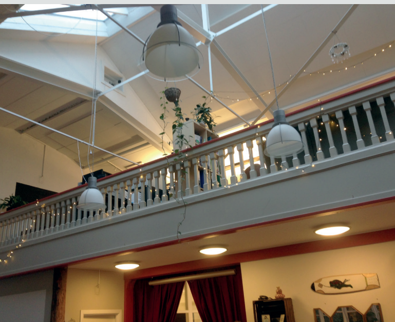
Interiør fra Fundamentet.