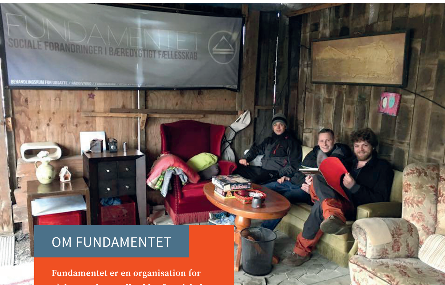
Hygge i sofabjørnet.