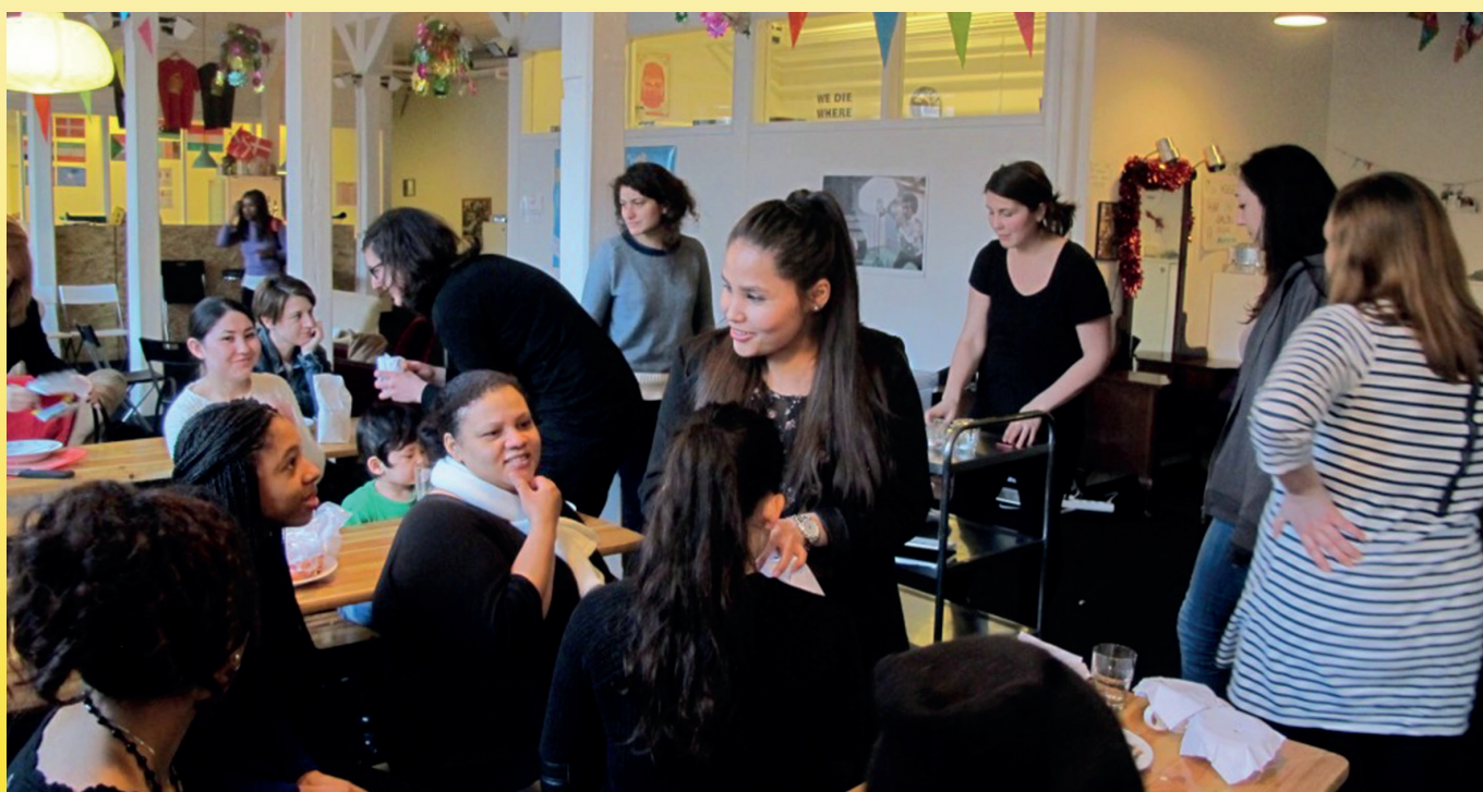
Der færdes alle typer af folk i det uafhængige flygtningecenter Trampolinhuset i København.

Grænsen er nået for uanstændighed i udlændingestrømninger. Men den grænse som mange politikerne vælger at overskride er også demokratiets etiske imperativ. Det er altså mere end nogle få tusinde flygtninge, vi skal redde, men faktisk hele demokratiet der er på spil. Så der er brug for et paradigmeskifte, som skal komme fra neden i dansk politik, fra det frivillige Danmark. Vi skal genopdage og frisætte den del af den demokratiske proces, som foregår under vandlinjen. Det frivillige Danmark skal træde i karakter og yde et sundt modspil i den politiske proces. Vi har brug for vores politikere, som tager et stort slæb med at lede landet. Men de har også brug for os, som den kraft i samfundet der kan holde den demokratiske proces på sporet. Alt for længe har vi ladet politikerne på Borgen i stikken. Det er nemlig kun os, der kan give dem deres moralske kompas tilbage. ●