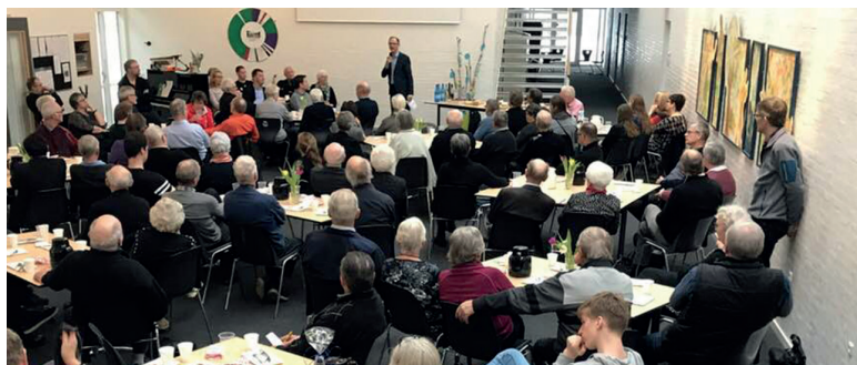
Der lyttes til landsformanden.

- Det forpligter. Nu er vi klar til Folketingsvalget, og der regner vi med at få samme gode opbakning her i området. Der er mange positive takter for partiet over hele landet. ●