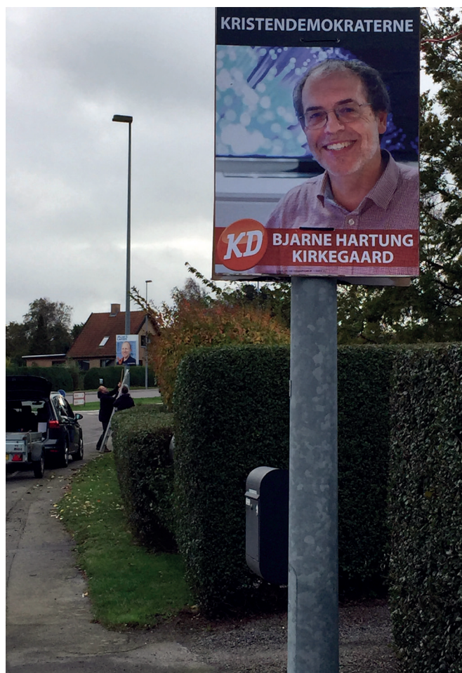
KristenDemokraterne havde omkring 60 valgplakater oppe i lysmaster m.v. på Bornholm ved KV 17.

kommende og tillidsbaseret. Men det skal forsøges. For det handler om arbejdsmiljø – og retten til at tænke selv. Indflydelse på egen dagligdag. Men den vender begge veje – for det kræver, at medarbejdere i plejen tager ansvar for det, de kan flytte. Og sender meldinger tilbage til os andre, når der er gode forslag – til det jeg og vi politikere har ansvar for.