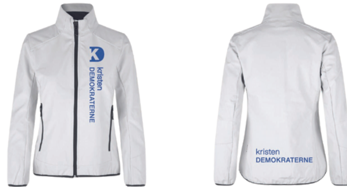
Jakke str. L og XL - 2 stk.