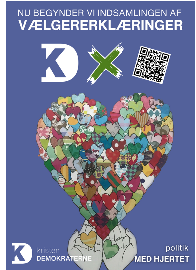
Plakater - 10 stk.