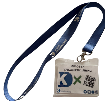
Nøglesnor - 10 stk.