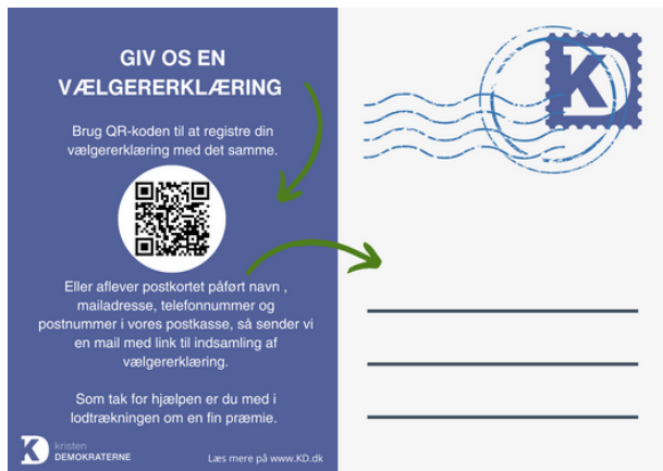
Postkort - 500 stk.